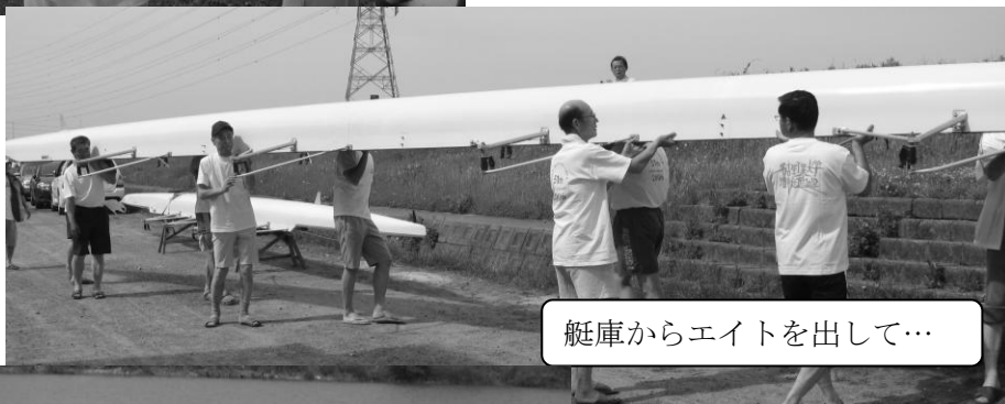
艇庫からエイトを出して…