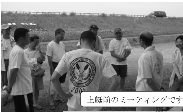
上艇前のミーティングです

5月8日(土)、晴れ渡る空の下、S46年卒のOBの皆様が名工大艇庫にOBエイトを乗りこいらっしゃいました。卒業してからもこのように同期で集まって乗艇することにボート部の結束力の強さを感じました。また、たくさんお話も聞かせて頂きました。