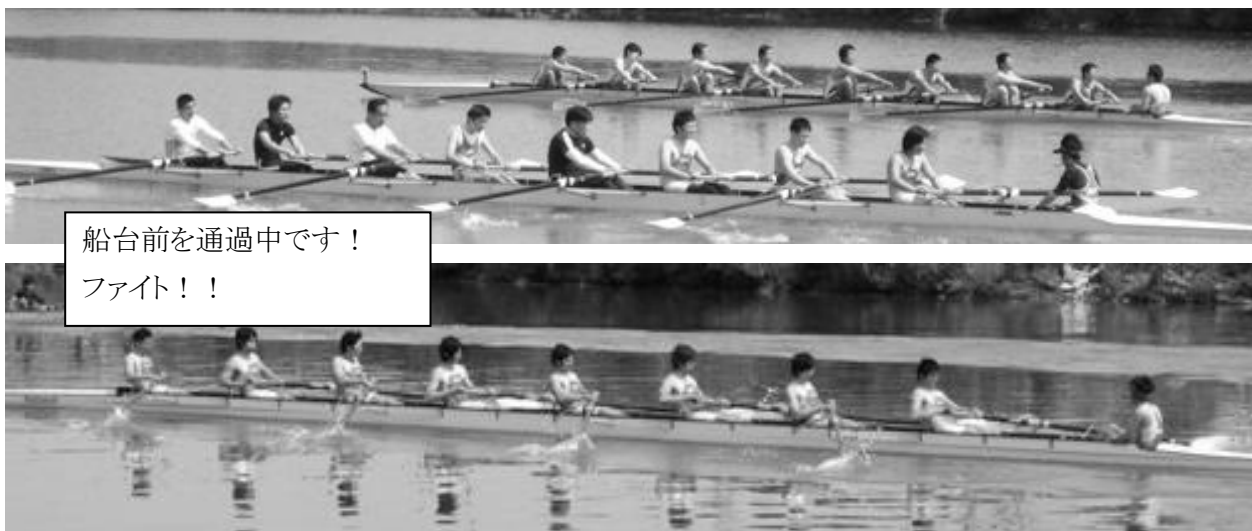
船台前を通過中です！ ファイト！！