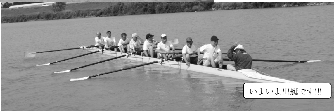
いよいよ出艇です!!!