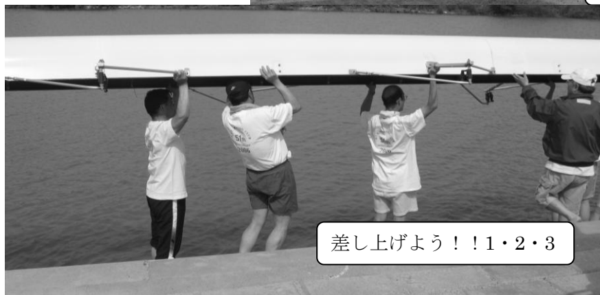
差し上げよう!!1・2・3