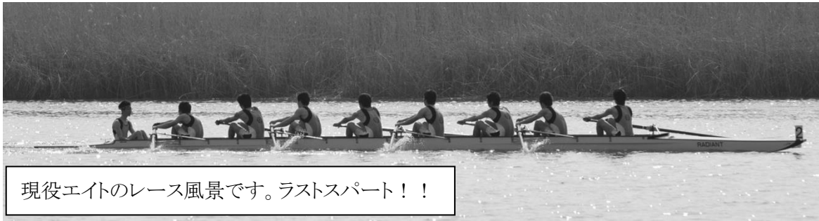
現役エイトのレース風景です。ラストスパート！！