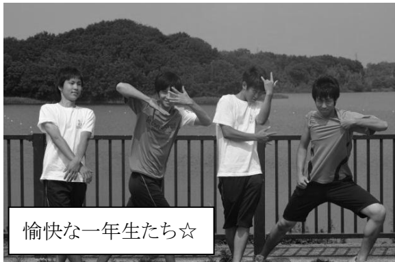
愉快的な一年生たち☆