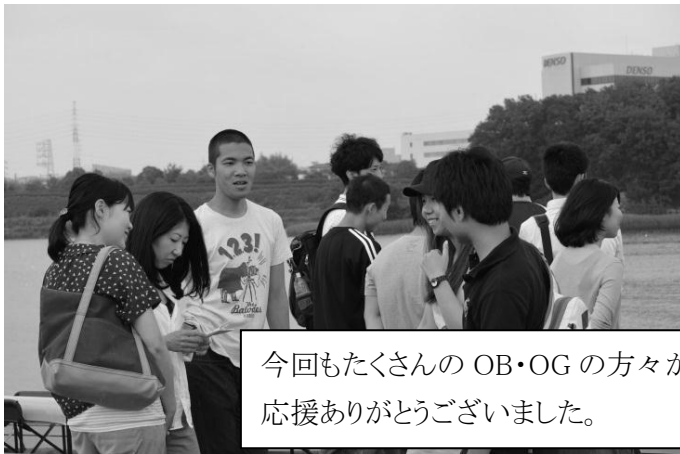
今回もたくさんのOB・OGの方々がお越しくださいました。 応援ありがとうございました。