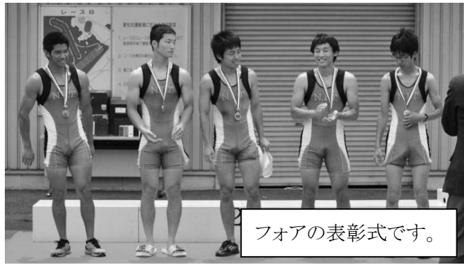
フォアの表彰式です。