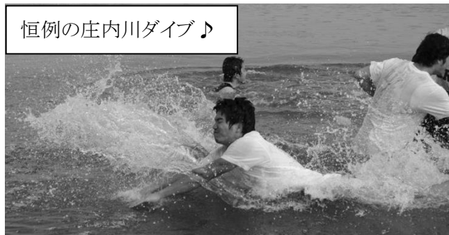
恒例の庄内川ダイブ♪