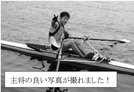
主将の良い写真が撮れました！