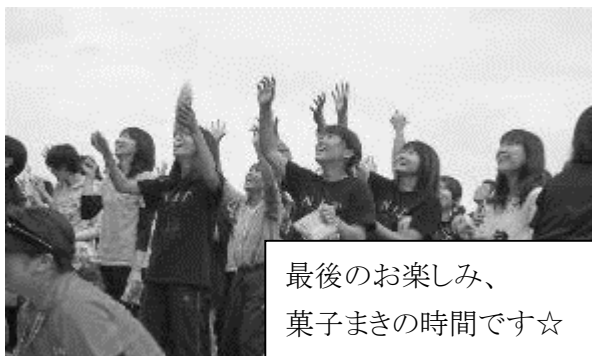
最後のお楽しみ、菓子まきの時間です☆