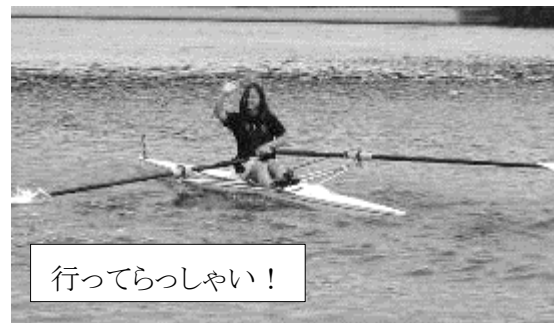
行ってらっしゃい！