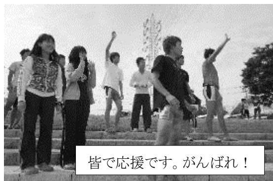
皆で応援です。がんばれ！