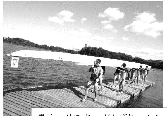
男子エイトです。がんばれー！！