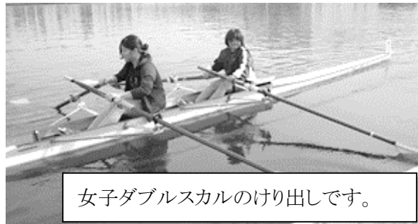
女子ダブルスカルのけり出しです。