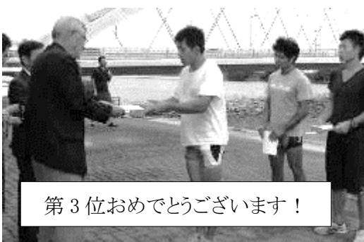
第3位おめでとうございます！