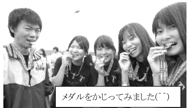
メダルをかじってみました(^_^)