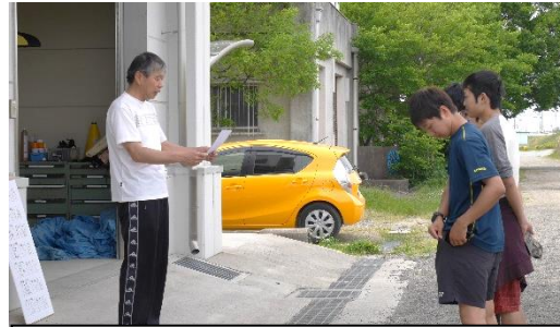
表彰式の様子です。入賞おめでとう！