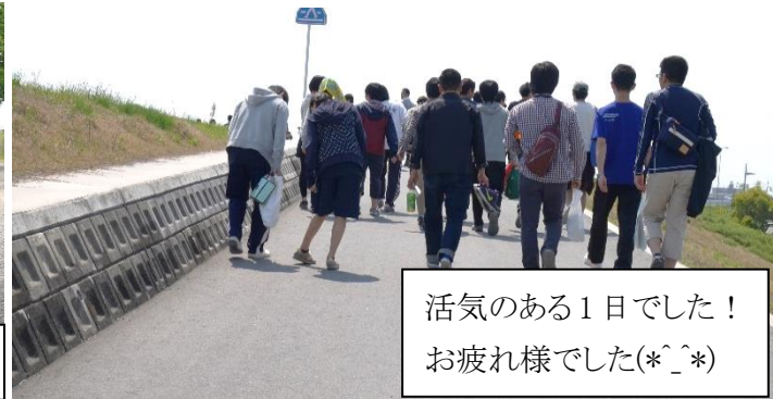
活気のある1日でした！ お疲れ様でした(*^_^*)