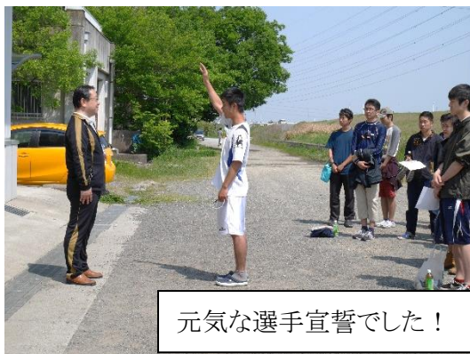
元気な選手宣誓でした！