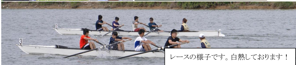
レースの様子です。白熱しております！