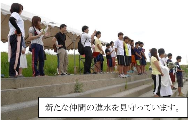
新たな仲間の進水を見守っています。