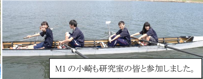
M1の小崎も研究室の皆と参加しました。