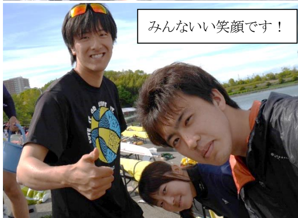
みんないい笑顔です！