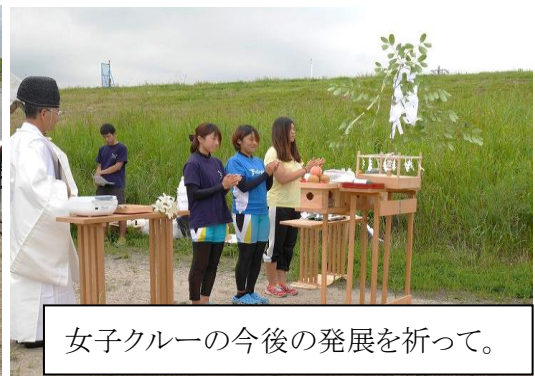
女子クルーの今後の発展を祈って。