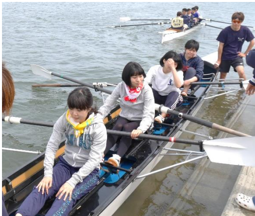
女性チーム、チームワーク抜群です！