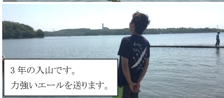
3年の入山です。 力強いエールを送ります。