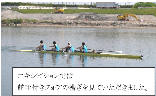
エキシビションでは舵手付きフォアの漕ぎを見ていただきました。