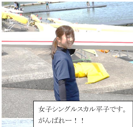
女子シングルスカル平子です。 がんばれー！！