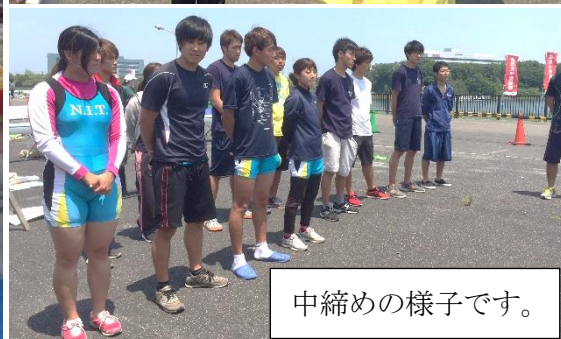
中締めの様子です。