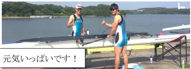
男子舵手なしペアです。元気いっぱいです！