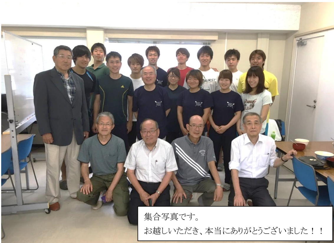
集合写真です。 お越しいただき、本当にありがとうございました！！