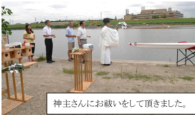
神主さんにお祓いをして頂きました。