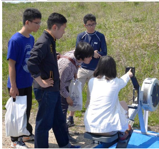
新入生の皆、いい笑顔です！