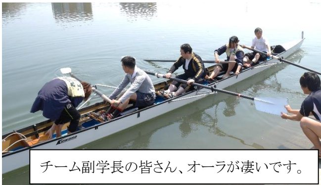
チーム副学長の皆さん、オーラが凄いです。