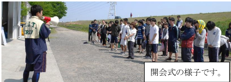
開会式の様子です。