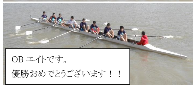
OBエイトです。 優勝おめでとうございます！！