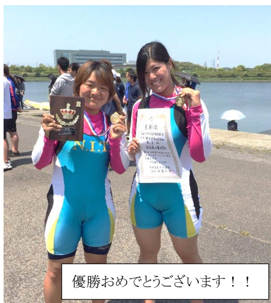
優勝おめでとうございます！！