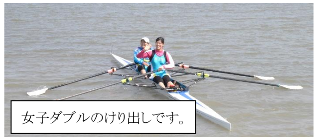
女子ダブルのけり出しです。