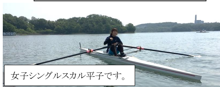
女子シングルスカル平子です。