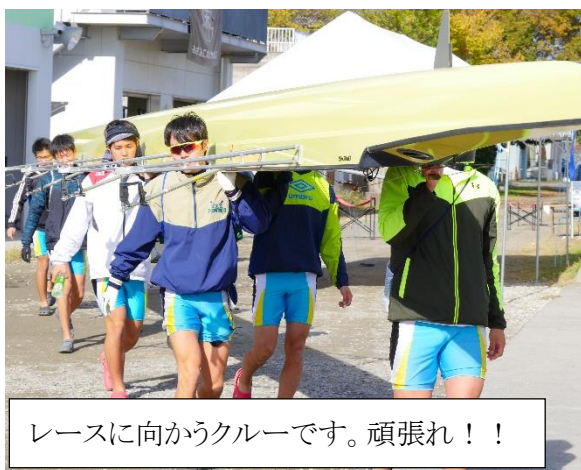
レースに向かうクルーです。頑張れ！！

今回の結果は負けてしまい悔しい結果となり、内容としても満足いくものではなく、後悔が残っています。1人で逆流逆風の中で立ち向かう精神力を培い、なにより自分が思うベストを常に保ち、向上させていく事が一番の課題であると改めて感じました。