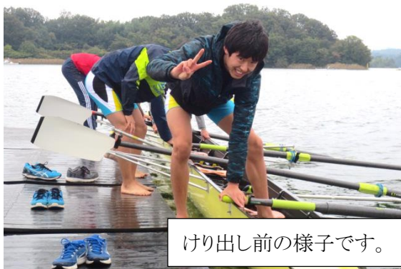
けり出し前の様子です。