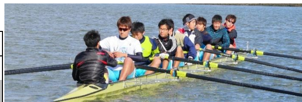
男子エイト、女子シングルスカルの けり出しの様子です。ファイト！