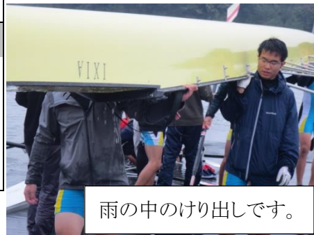
雨の中のけり出しです。