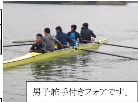
男子舵手付きフォアです。