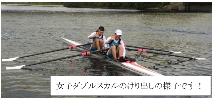
女子ダブルスカルのけり出しの様子です！