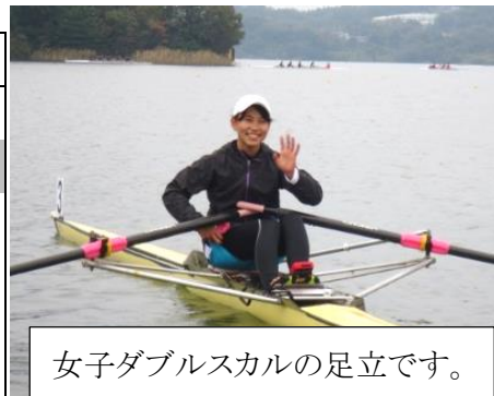
女子ダブルスカルの足立です。